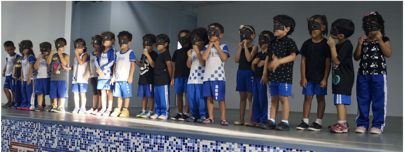
A programação contou com a participação dos alunos do Maternal ao 3º Ano

De 17 a 24 de fevereiro, os alunos do Maternal ao 3º Ano do Centro de Educação do Trabalhador João de Mendonça Furtado- CET/SESI participaram de uma programação voltada para conscientização sobre o Aedes aegypti , transmissor da dengue, febre chikungunya, zika e febre amarela.