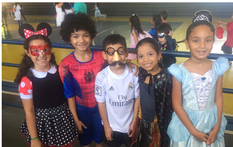
O evento reuniu alunos, pais e toda comunidade escolar

A programação foi um sucesso! Pais, alunos e professores en-