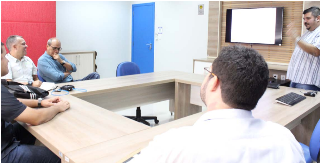
Entrega de Relatórios de Eficiência Energética

Em tempos de recursos cada vez mais escassos, a redução de custos é uma das principais ações a serem adotadas em qualquer corporação. Em Boa Vista, o SENAI/RR atua na área de assessoria e consultoria com produtos e serviços que podem ajudar a melhorar o desempenho das empresas, aumentar sua produtividade e competitividade no mercado. Um dos Serviços de Tecnologia e Inovação (STI) que a unidade oferece ao setor produtivo é o de Energia, que tem o objetivo de prover o uso eficiente do recurso nas empresas.