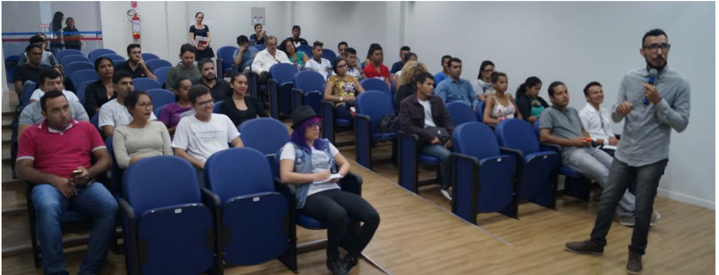
Evento abordou Mídias Sociais

O Instituto Euvaldo Lodi- IEL/RR realizou no dia 23 de fevereiro o curso “Marketing Digital na Prática”. O objetivo foi levar conhecimento atual e de qualidade para que os participantes aprendessem como a internet pode ser uma aliada para ganhar dinheiro.