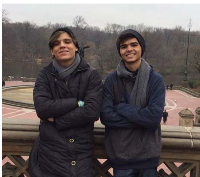
Estudantes-do SESI em visita a Universidade estadunidense