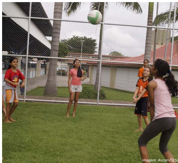
Crianças do projeto durante atividade recreativa

No mês de agosto serão realizadas as Avaliações Física e Atitudinal das crianças e dos adolescentes. A avaliação física é feita para mensurar o nível de força, resistência e coordenação motora, para, a partir do resultado, melhorar a capacidade física ao longo do programa. Já a Avaliação Atitudinal