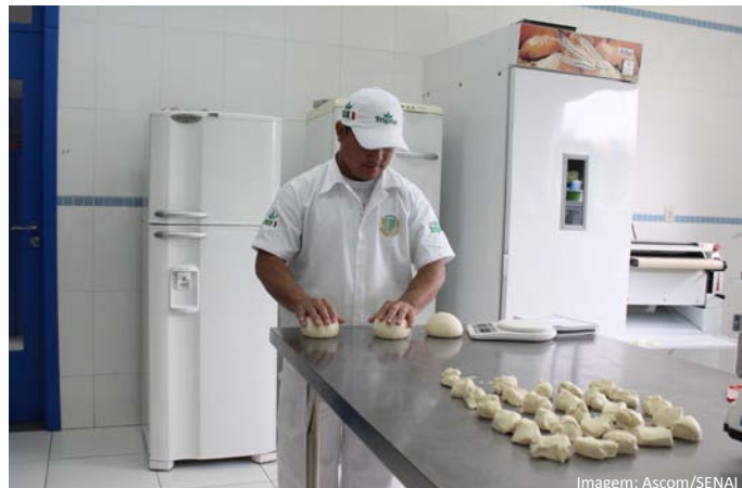
Técnico da Trigolar durante atividade no SENAI/RR