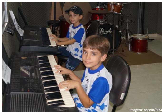
Alunos aprendendo a tocar teclado.

Já o Lazer Cultural oferece Musicalização com Teclado, Bateria, Violão, Prática de Banda e Teoria Musical. O Critério para fazer parte é ter 6 anos completos e disposição para aprender, ou seja, crianças, adolescentes, jovens, adultos e idosos podem se inscrever nesse projeto.