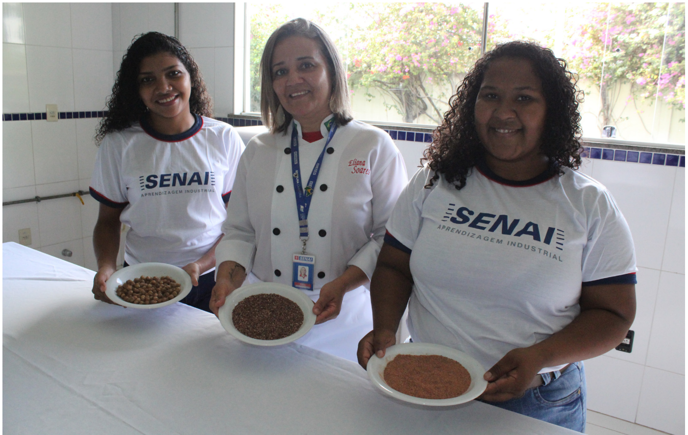
Representantes do SENAI na etapa Nacional

Farinha do caroço de açaí concorreu com outros 310 e ficou em 18º lugar