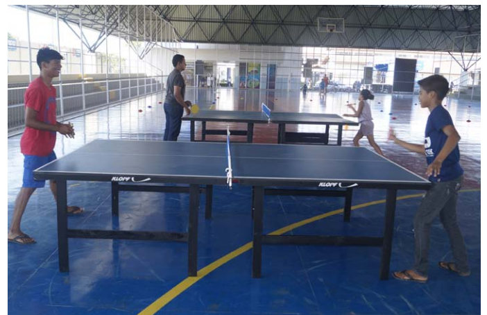
Tenis de mesa