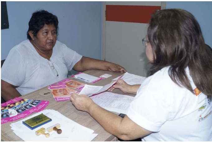
Exame Clínico das Mamas