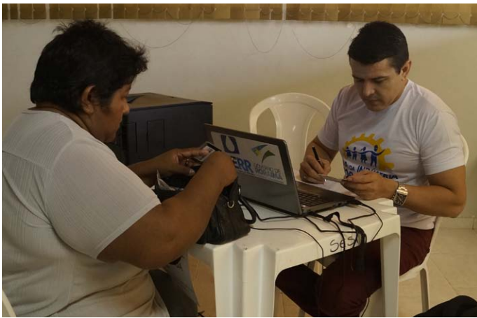
Parcelamento de débitos com a CAER