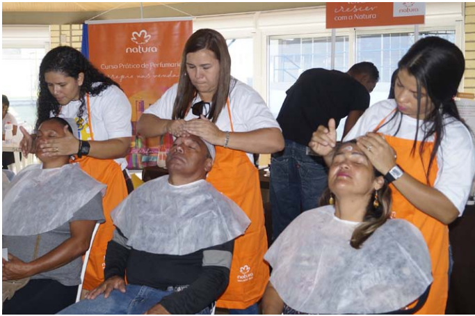
Limpeza de pele