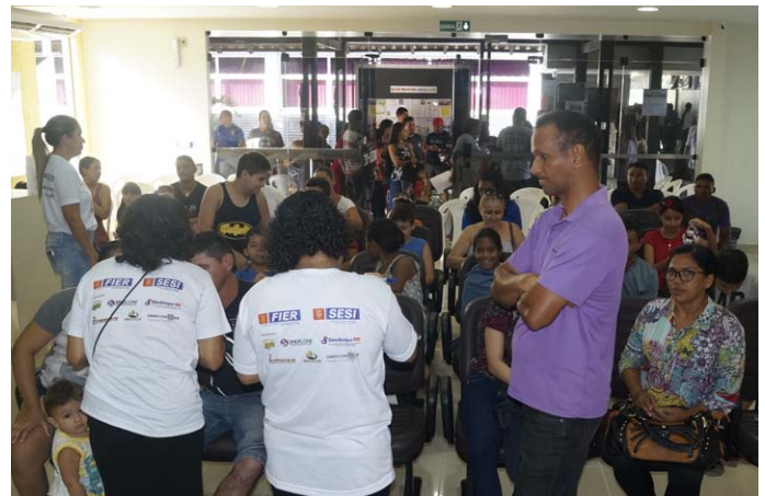
Atendimento para os serviços da área de saúde