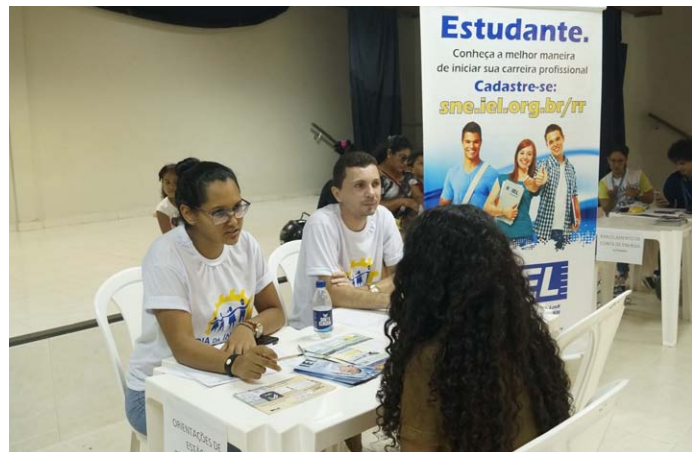
Orientações para estágio