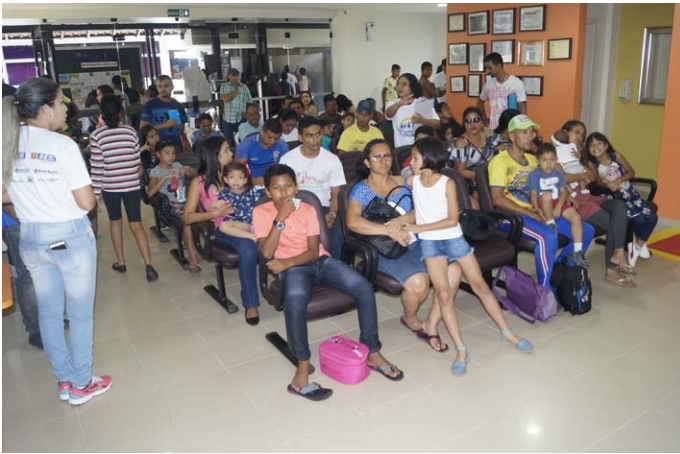
Sala de Espera da Saúde