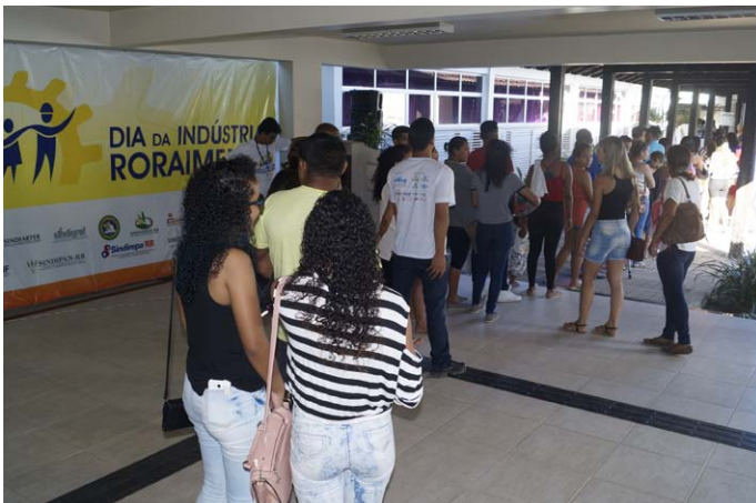
O público chegou cedo no local para garantir atendimento