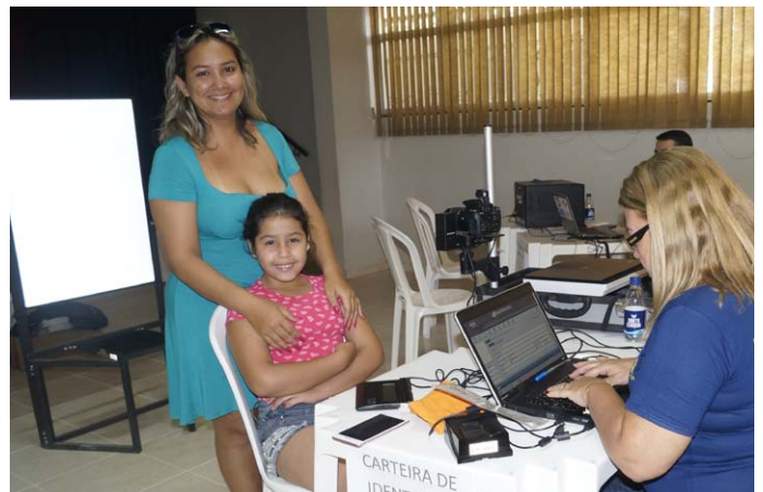
Emissão de R.G.