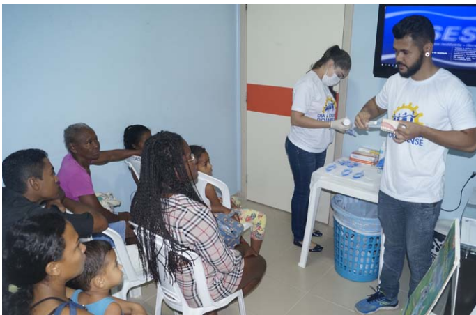
Orientações sobre saúde bucal