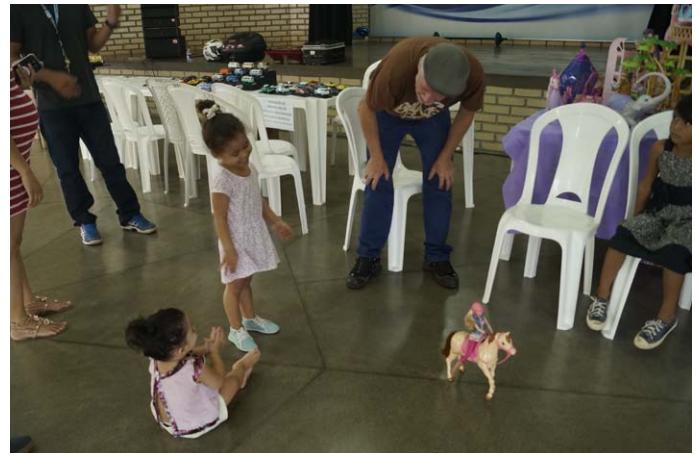
Exposição da Barbie