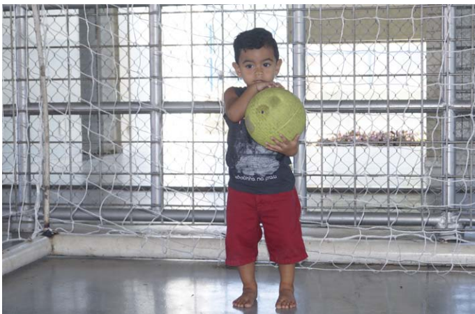
atividades de futsal