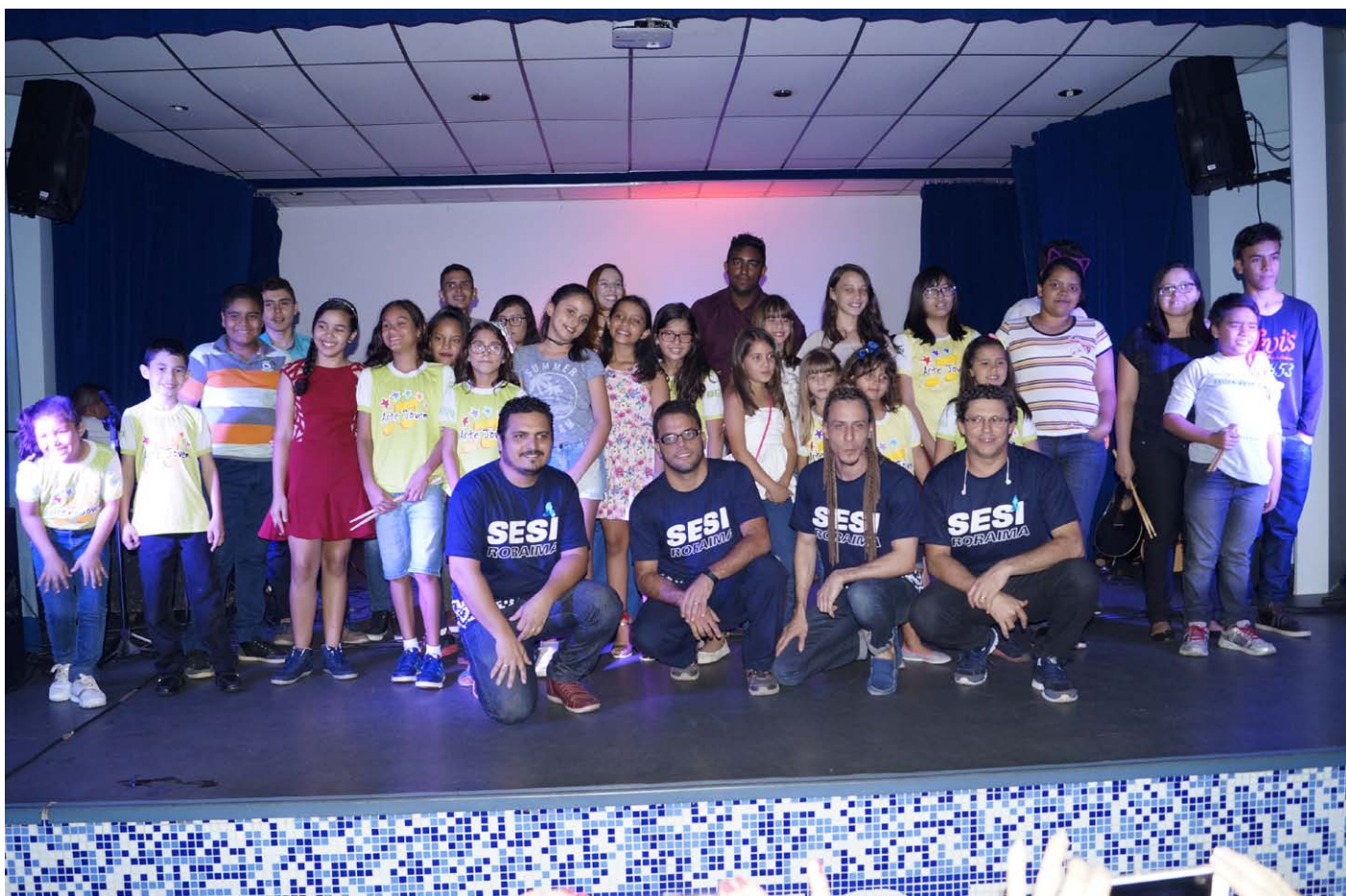
Alunos e professores no segundo dia de apresentações

Os alunos dos Projetos Arte Jovem e Lazer Cultural participaram de 21 a 23 de novembro do Recital 2017, que teve o objetivo de incentivar a cultura local, demonstrar e valorizar o resultado do aprendizado dos alunos dos projetos junto aos familiares, os trabalhadores da indústria, comunidade em geral e demais convidados.