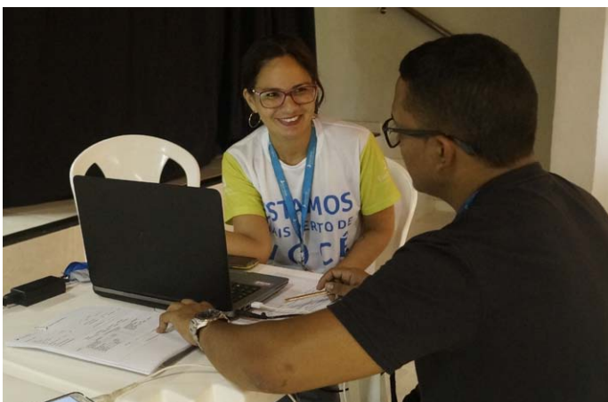
Orientações sobre consumo de energia