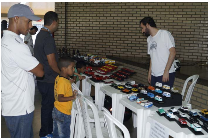
Exposição de miniaturas