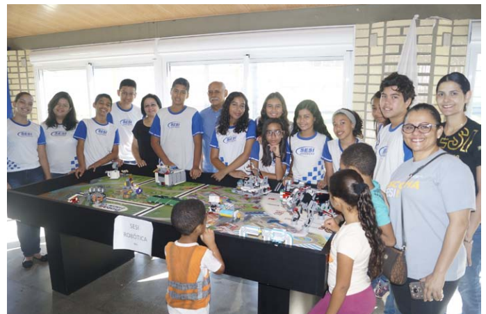
Exposição de robótica