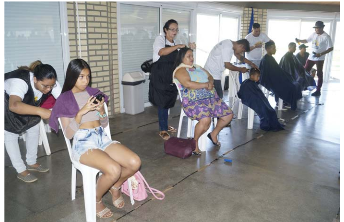
Corte de cabelo