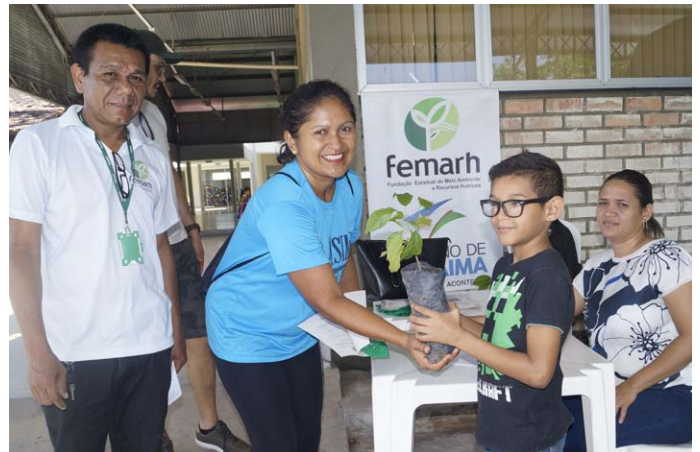
Distribuição de mudas