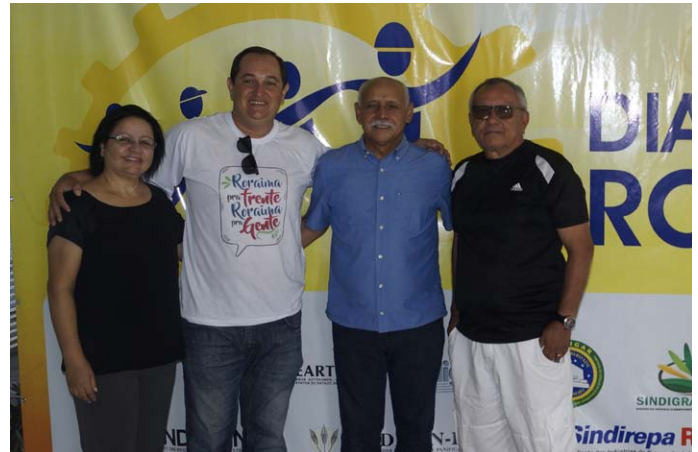
Superintendente da FIER e SESI com o Presidente da FIER e participantes do evento