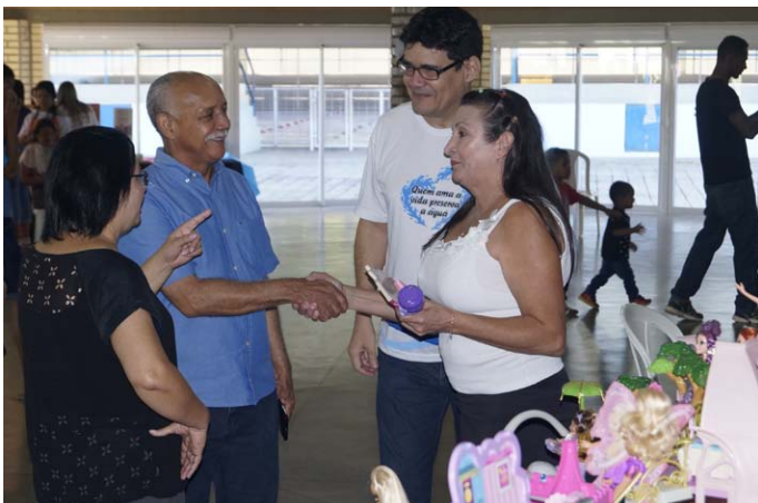
Diretor do SESI cumprimentando expositora de miniaturas