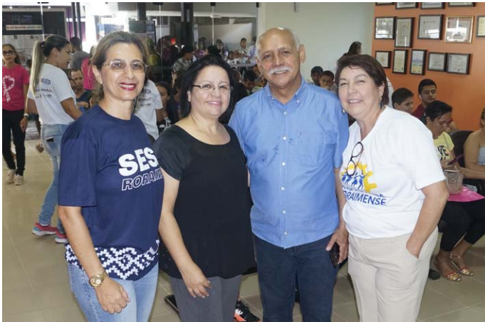
Coordenadoras do SESI com a Superintendente e Diretor do SESI