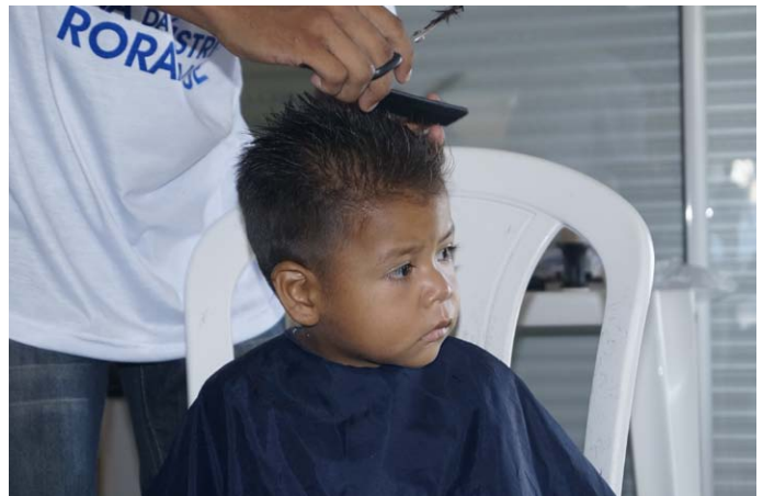
Corte de cabelo