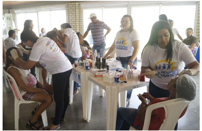
Limpeza de pele