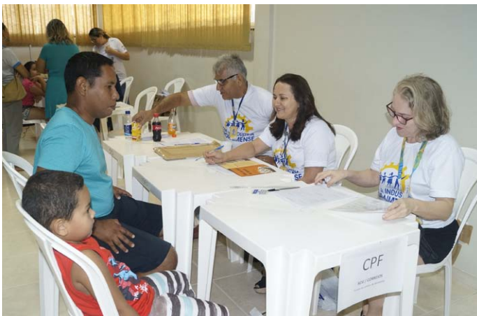
Emissão de CPF