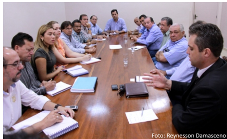
Vice Prefeito reunido com setor empresarial

Cadastro, após vistoria para que se possa calcular o pagamento da guia.