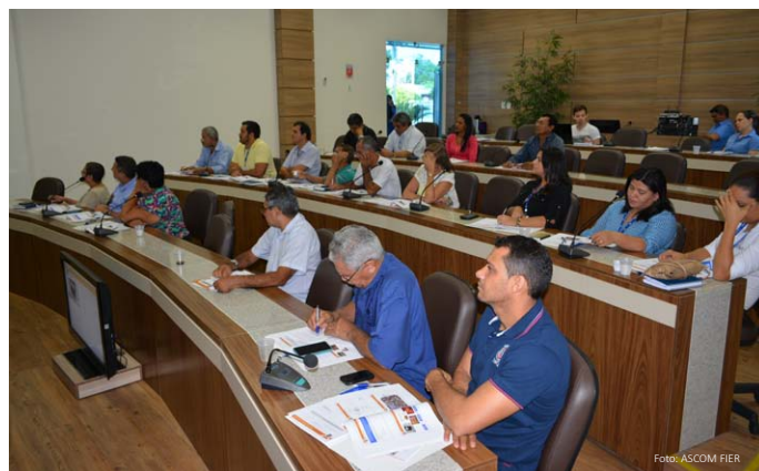
Representantes sindicais e do Sistema Indústria de Roraima

No dia 10 de março, alguns representantes sindicais iniciaram a tarde com uma atividade inusitada, a gravação de uma entrevista sobre sua atuação e contribuições para o fortalecimento de sua classe empresarial em Roraima, o que eles não sabiam é que a entrevista era uma das atividades da oficina que seria analisada posteriormente.