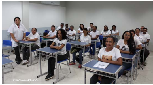
Alunos durante oficina

A Oficina conta com a presença de 60 participantes, divididos em três turmas, que atuam diretamente no setor alimentício da empresa, como fabricação e transporte. Os participantes estão sendo orientados sobre os cuidados durante a obtenção, arma-