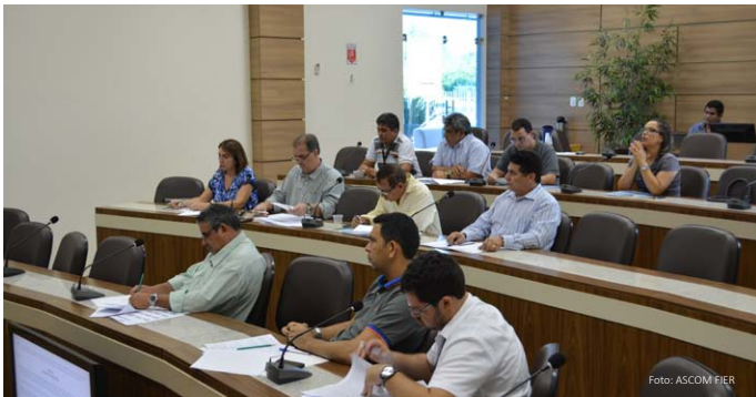
Membros do conselho durante 1ª reunião ordinária de 2016

Os membros do Conselho Temático de Meio Ambiente, Recursos Naturais, Energia e Infraestrutura – CTMAR, reuniram-se para a primeira reunião ordinária de 2016, no dia 08 de março, no auditório da Federação das Indústrias de Roraima – FIER.