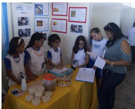
Projeto Matemática na Cozinha, classificado em 2º lugar