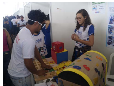
Projeto O Baú da Matemática, classificado em 3º lugar