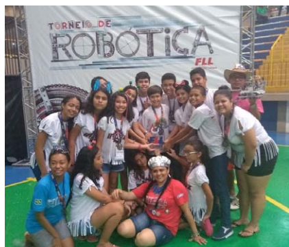
Equipe Makunaima, ganhadora do prêmio Estrela Iniciante