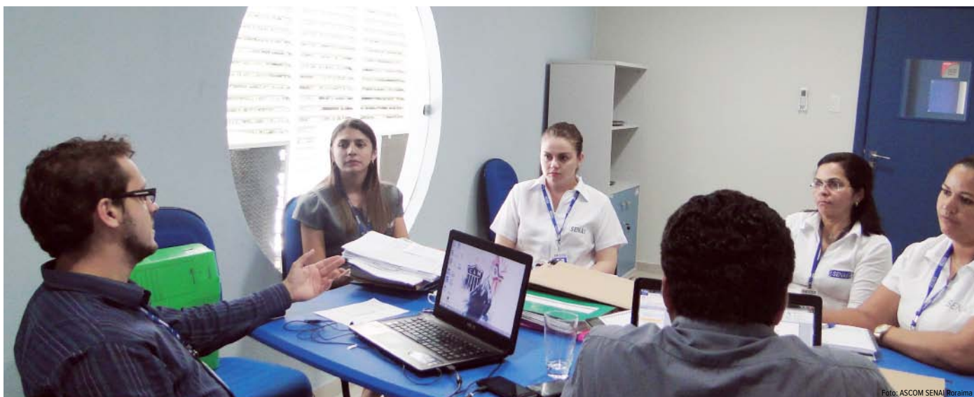
Avaliadores visitam SENAI Roraima para monitoramento do Pronatec

O Centro de Formação Profissional Prof. Alexandre Figueira Rodrigues – CFP recebeu no período de 20 a 23 de outubro a visita de dois integrantes da equipe de monitoramento do Programa Nacional de Acesso ao Ensino Técnico e Emprego – Pronatec. Os técnicos são auditores independentes, contratados pelo Departamento Nacional, e tem como objetivo coletar informações acerca das instalações físicas, recursos didáticos, financeiro e processos pedagógicos.