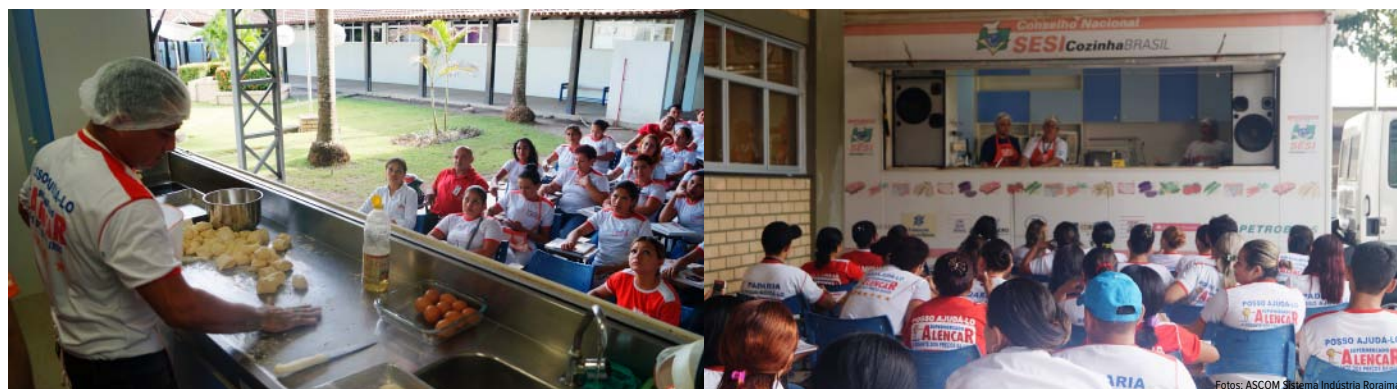
120 colaboradores aprendem dicas de alimentação saudável e como preparar refeições aproveitando 100% dos alimentos

No período de 16 a 18 de outubro, o Programa de Educação Alimentar do SESI, Cozinha Brasil em parceria com o Supermercado Alencar realizou um ciclo de palestras e cursos de culinária para 120 colaboradores da empresa.