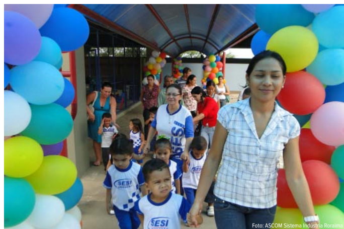
Os trabalhadores interessados podem se dirigir a secretaria da Escola e preencher a ficha de solicitação de vaga para o maternal

Isso ocorre porque o SESI foi criado para atender a indústria e aos seus dependentes com serviços de educação, saúde, lazer e responsabilidade social, priorizando esta clientela.